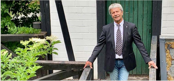
Die Dümmlinghauser Mühle ist ein prägnantes Bauwerk, ein auch überregional gern genutzter Ort der Begegnung.