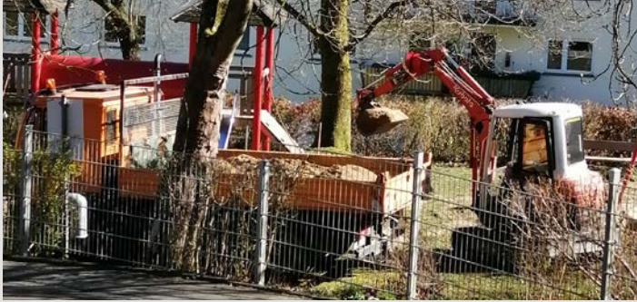
Auch in Corona Zeiten kam das Leben nicht ganz zum Stillstand, die „spielfreie“ Zeit wurde genutzt um den Sand auf dem Spielplatz in der Hömerichstraße zu tauschen.